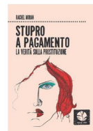
Rachel Moran autrice di "Stupro a pagamento. La verità sulla prostituzione"